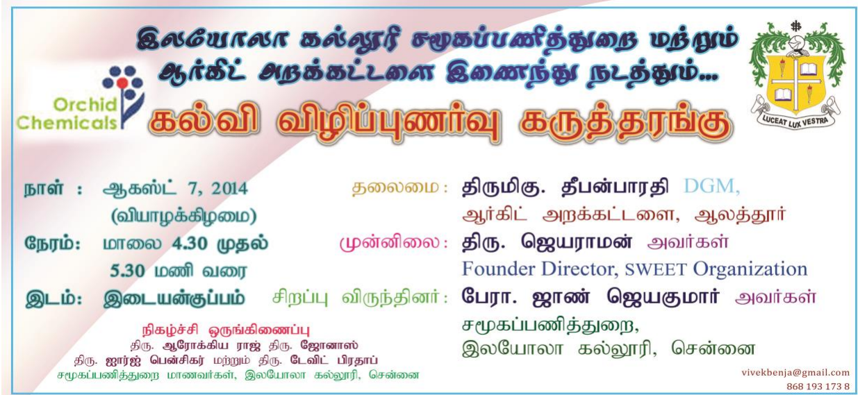
Banner of the event

A Education Awareness documentary film "One mark" was screened for parents & Children of the village to create better understand about the value of education.